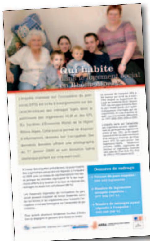
couverture de la plaquette OPS 2009

Vous pouvez dès à présent, si vous le souhaitez, faire part à soizic.cezilly@developpement-durable.gouv.fr de votre intérêt à participer à cet atelier et des sujets de réflexion que vous aimeriez y voir traités.