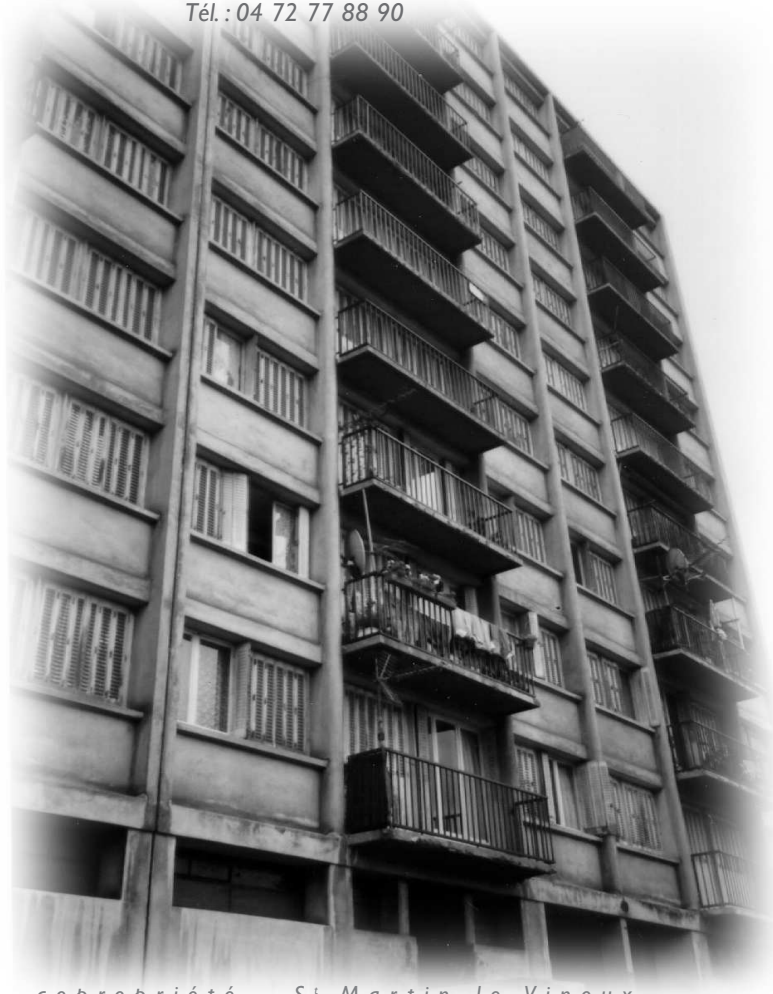
copropriété - St Martin le Vinoux

*** CETE : Centre d'Études Techniques de l'Équipement